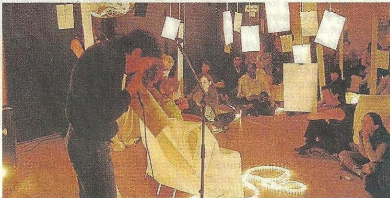
La performance Electro Poetic en pleine représentation.

Vendredi 24 et samedi 25 février, 20 h. Réservations : 02 41 05 38 38. Tarifs : 4 à 5 €